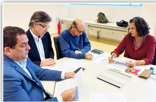
Entrega da Pauta Unificada, em 19/4, na reitoria da USP

de reposição necessário para recuperar o poder de compra daquele ano está estimado em cerca de 18% . Este percentual ainda pode ser alterado, para mais ou para menos, quando for divulgada a inflação de abril/2024. A reivindicação está apresentada assim: