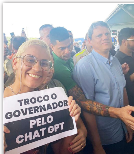
Estudante da Unesp carrega cartaz durante visita do governador em Franca

Diante da repercussão negativa da medida, o governador tentou sair pela tangente. “Nada vai substituir o papel do professor, até porque a responsabilidade dentro da sala de aula é do professor”, disse Tarcísio ( Folha de S. Paulo , 17/4/2024). Ele voltou a defender que o trabalho dos docentes é feito com entusiasmo e paixão. “No fim das contas, quem sabe o que vai ministrar e vai fazer com entusiasmo é o professor. Porque ele é um vocacionado, é um apaixonado.”