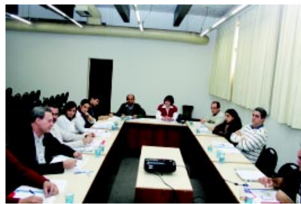
Alguns dos grupos de discussões montados durante o 'I Fórum'

em referência ao caderno preparatório ao 'I Fórum', um documento de 144 páginas que reflete as mais diversas queixas vindas de todas as unidades da Unesp. "Somos plenamente favoráveis à implantação de um sistema de avaliação docente e acreditamos que ele é indispensável. No entanto, a avaliação docente deve ser 'negociada'. Ela não pode ser imposta, unilateralmente, pelas instâncias superiores da universidade. Ela deve resultar de um amplo debate, e precisa, ainda, contemplar as especificida-