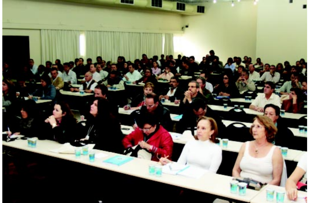
O 'I Fórum' registrou a presença de 210 pessoas. Os critérios permitiram a participação de 5% dos docentes em cada unidade

As fotos do evento foram cedidas ao Adunesp Informa pela Comissão Organizadora