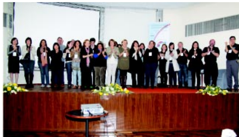
Membros da Comissão Organizadora e professores que contribuíram na realização do 'I Fórum', durante o encerramento do evento