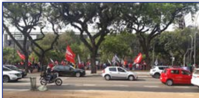
Flashes do ato na Alesp em 16/9

rejeitem o PL nº 529/20 e defendam o serviço público paulista.